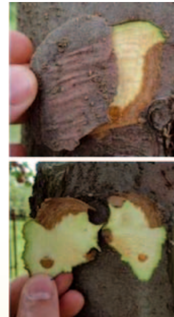
Flach verlaufende, oftmals leicht eingesunkene Rindennekrosen.

Durch Untersuchungen und Versuche im Labor sowie im Freiland konnte der Pilz Diplodia mutila als Verursacher für das Absterben der Apfelbäume identifiziert werden. Dieser Schadpilz ist ein Schwächeparasit, der häufig an durch Hitze- oder Trockenstress vorgeschädigten Pflanzen auftritt. Er ist außerdem in der Lage, pflanzliches Gewebe symptomlos zu befallen und erst nach