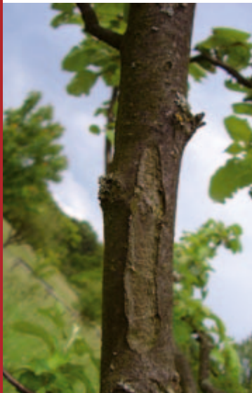
Großflächige Einsenkung in der Rinde