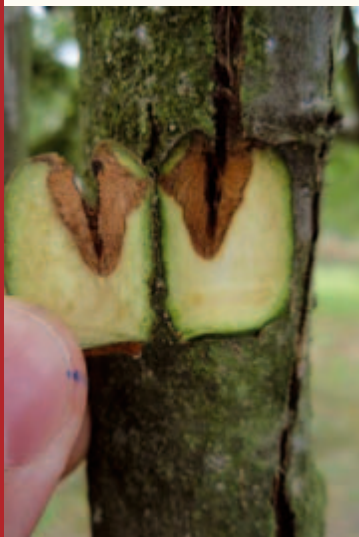
Nicht verheiltes Wundgewebe mit beginnender Nekrosenbildung.

Seit dem heißen und trockenen Jahr 2003 erregten Meldungen über absterbende Apfelbäume und eine „neuartige Rindenerkrankung“ nicht nur beim zuständigen hessischen Pflanzenschutzdienst große Besorgnis, sondern sorgten auch in der regionalen und überregionalen Presse sowie in der Öffentlichkeit für verstärkte Aufmerksamkeit.