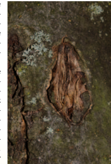
Wenige cm große tiefe Einsenkung in der Rinde

Man sollte den Bäumen, die weiter gepflegt werden, eine möglichst ausgeglichene Versorgung mit Wasser und Nährstoffen ermöglichen, um ihren Zustand zu stabilisieren. Bei lang anhaltender Trockenheit sollte bewässert und nach einer Bodenprobe die nötigen Nährstoffe nachgedüngt werden. Es empfiehlt sich, etwa 100 Liter pro Baum zu geben, um den Wurzelbereich möglichst durchdringend zu befeuchten. Außerdem