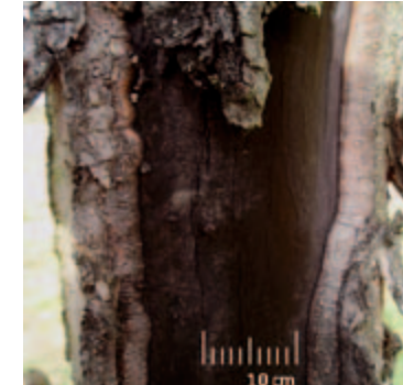
Stark betroffener Stamm mit schwarz gefärbtem, offen liegendem Splint.

sollte eine Baumscheibe um jeden Baum frei von jeglicher Vegetation gehalten werden, um eine mögliche Konkurrenz um Wasser und Nährstoffe auszuschließen und Wühlmäusen, die durch Wurzelfraß schaden, Versteckmöglichkeiten zu rauben. Verletzungen durch Mäharbeiten und große Schnittwunden sind dringend zu vermeiden, da sie neue Eintrittspforten für den Pilz bieten. Es werden trotzdem regelmäßige Schnittmaßnahmen, die die Vitalität der Bäume erhalten, empfohlen. Schnittwunden sollten entweder gar nicht mit einem Wundverschlussmittel bestrichen werden oder aber mit einem Fungizidhaltigen Mittel. Auf keinen Fall sollten Mittel ohne Fungizid verwendet werden, da dieses den Pilzbefall nur fördert. Diese Maßnahmen sind allerdings nur sinnvoll, wenn kein zu schwerer Befall vorliegt und noch Hoffnung auf eine Stabilisierung oder Besserung des Zustands besteht.