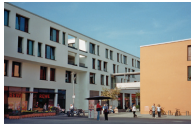
K&S Seniorenresidenz Kelkheim