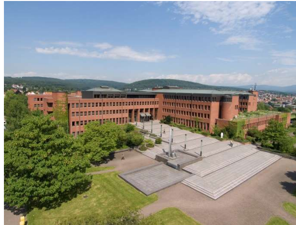
Landratsamt, Am Kreishaus 1-5, 65719 Hofheim