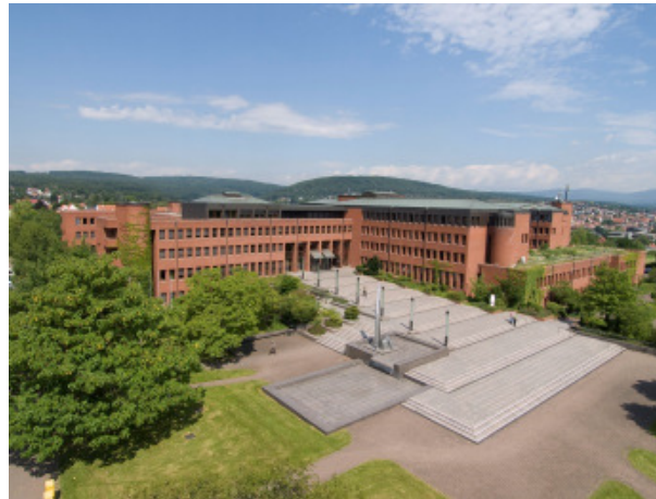
Landratsamt, Am Kreishaus 1-5, 65719 Hofheim

Sie möchten mehr über Themen des Kreises wissen?